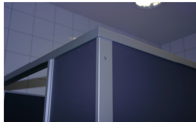
Detail Eckverbindung Vorderfront zur Seitenwand Kopfschiene (Rohr) auf Gehung. Verbindung der Platten mit einem modernen L-Profil das einen Aussenradius von 2mm hat (unfallsicher).