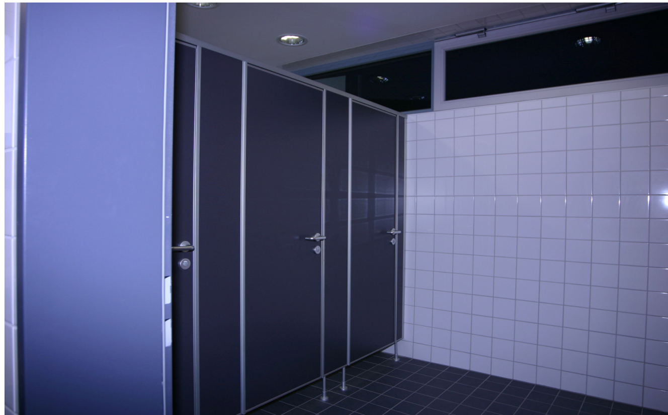
30 mm Spannplattenanlage alle Kanten mit Aluminium U-Profilen 12/34/12/2 eingefasst. Türen nach innen öffnend