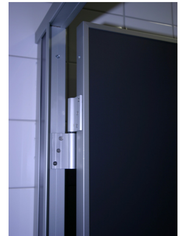
Detail Bandseite offene Türe Anschlagprofil oben mit Rohr bündig.