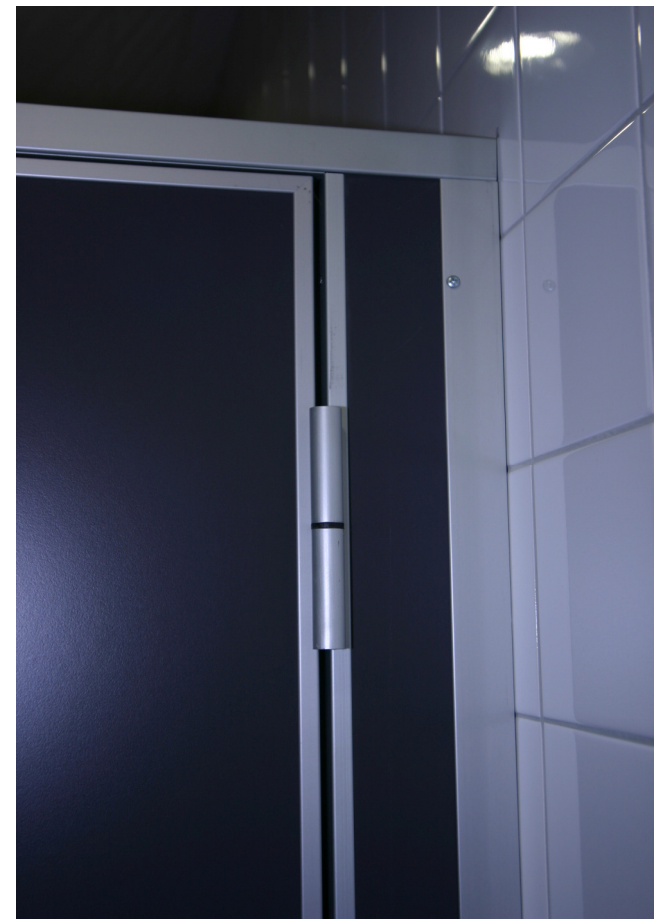
Detail Maueranschluss mit U-Profil 35/35/35/2 Kantenband in Alu