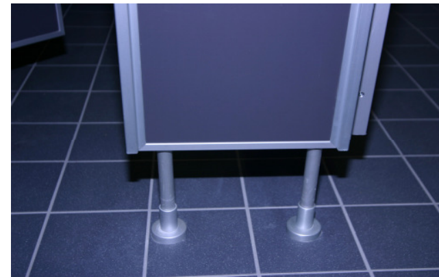
Detail Vorderfront Mittelteil Füße u. Fußrossetten in Alu eloxiert. U-Profile 12/34/12/2 Ecken auf Gehung dadurch alle Kanten geschlossen.